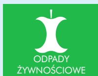
BRĄZOWY POJEMNIK NA ODPADY