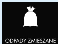
SZARY POJEMNIK NA ODPADY