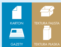
ZIELONY/NIEBIESKI POJEMNIK NA ODPADY